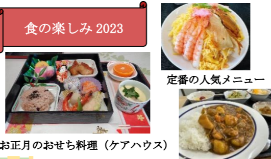
定番の人気メニュー